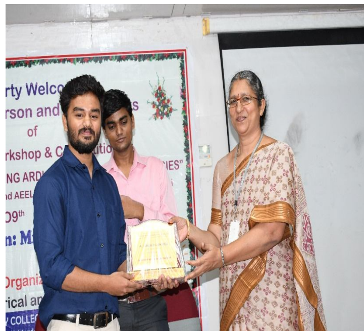
HOD of EEE Felicitating Resource person with a Memento.