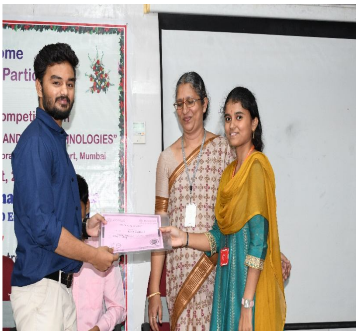
Resource person presenting certificate to the participant.